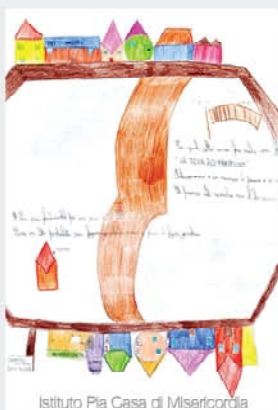
Istituto Pia Casa di Misericordia