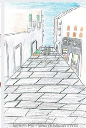
Istituto Pia Casa di Misericordia