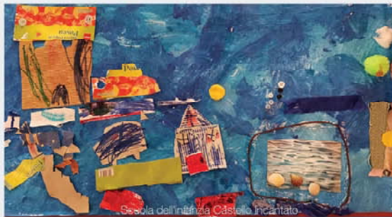
Scuola dell'infanzia Castello Incantato